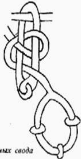
и) Три небесных свода