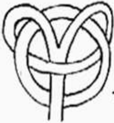
д) Мировое дерево